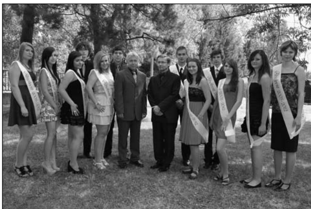
Loučení s 9. třídou.