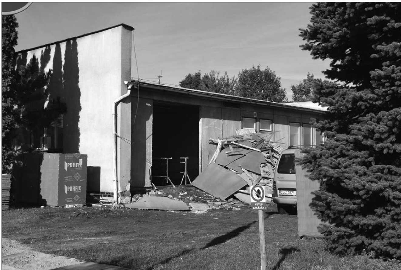
Rekonstrukci pavilonu MŠ provádí firma Tost.cz