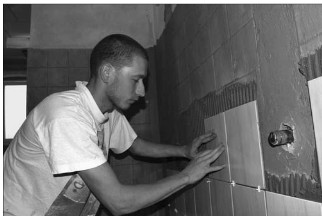
Obkladačské práce ve sprchách u haly BIOS.