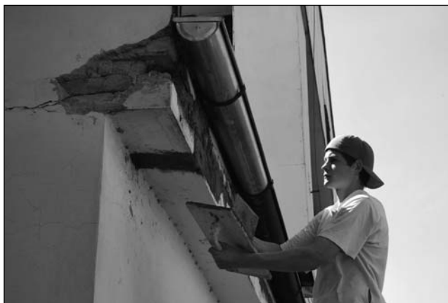
Oprava římsy nad vchodem u haly BIOS.