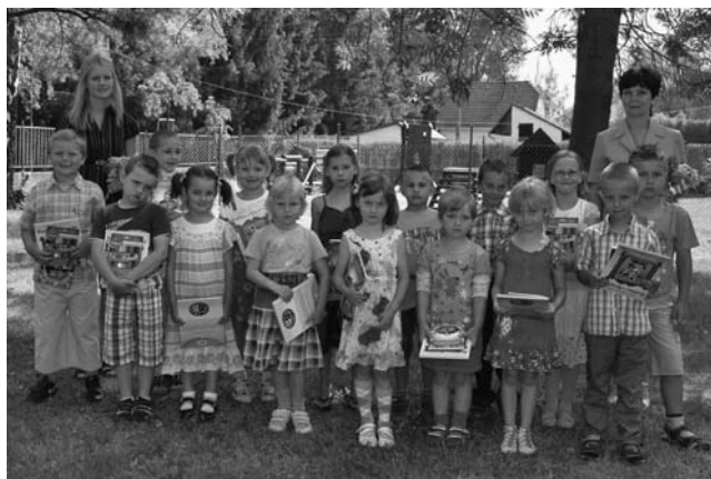
Loučení s předškoláky