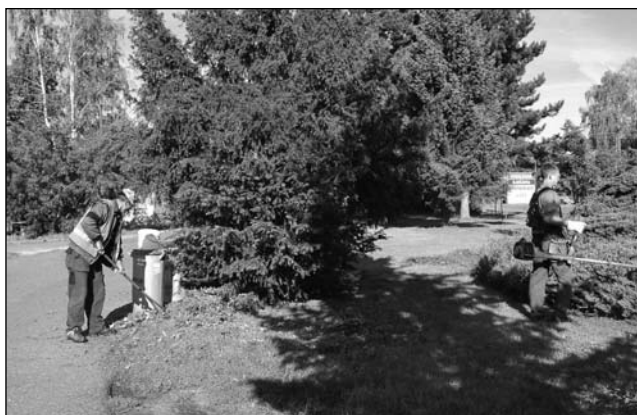
Při údržbě zeleně pomáhají brigádníci z řad studentů a pracovník přes úřad práce.